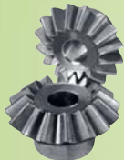
Kegelräder – Modul 1,0 bis 4,0